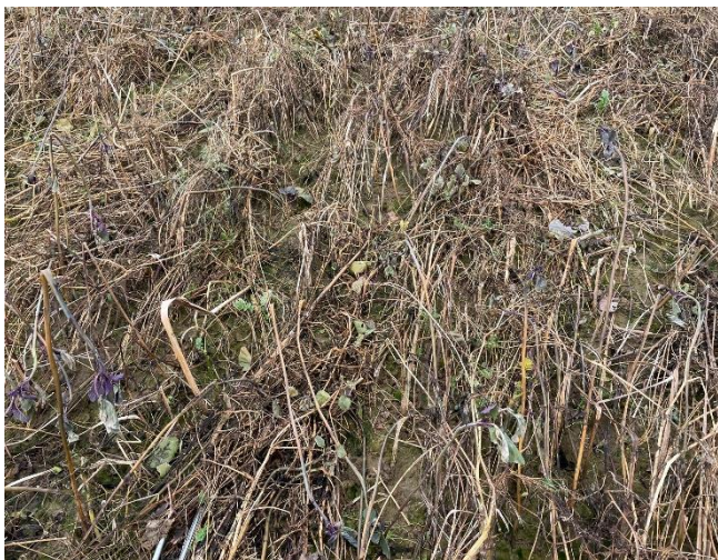
Abbildung 2: Abgefrorene Zwischenfrucht im Frühjahr

Eine flache Bodenbearbeitung im Frühjahr garantiert, dass die durch die Zwischenfrucht gebildete Boden-gare nicht zerstört wird.